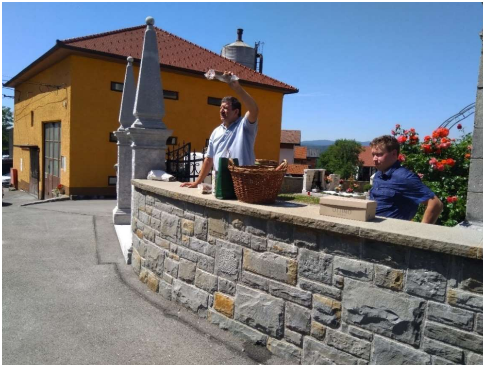
Kamnito obzidje in licitacija krač