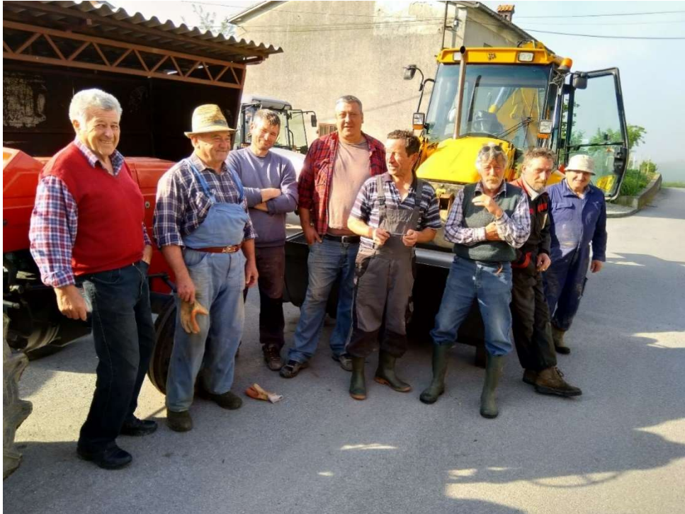
Zbor udarnikov za tradicionalno roboto v Podstenjah