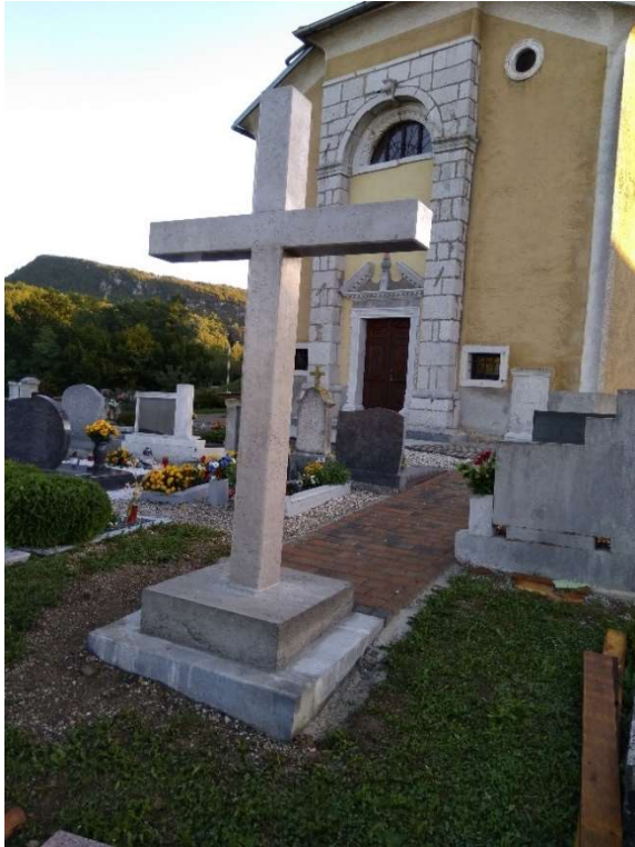
Postavitev kamnitega križa