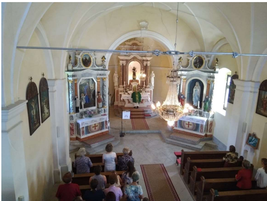
Notranjost cerkve Sv. Antona Padovanskega

Na severovzhodni strani stoji kamniti zvonik opremljen s tremi zvonovi z električnim pogonom in avtomatsko uro.