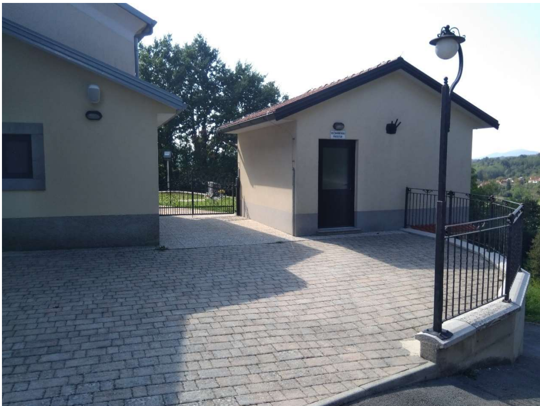
Mrliška vežica in dodatni prostori

Skupaj s sredstvi za cerkev Sv. Antona Padovanskega smo kupili tudi ozvočenje, ki služi za pogrebe in svete maše in ozvočenje v primeru pogreba.