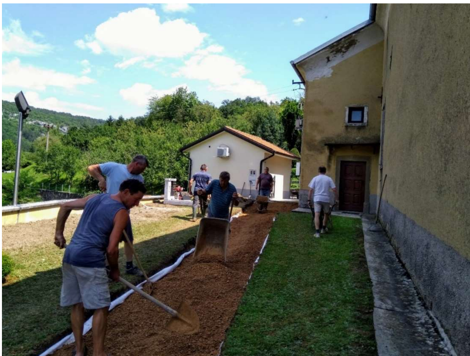
Priprava za tlakovanje pokopališča – prostovoljci iz vseh treh vasi