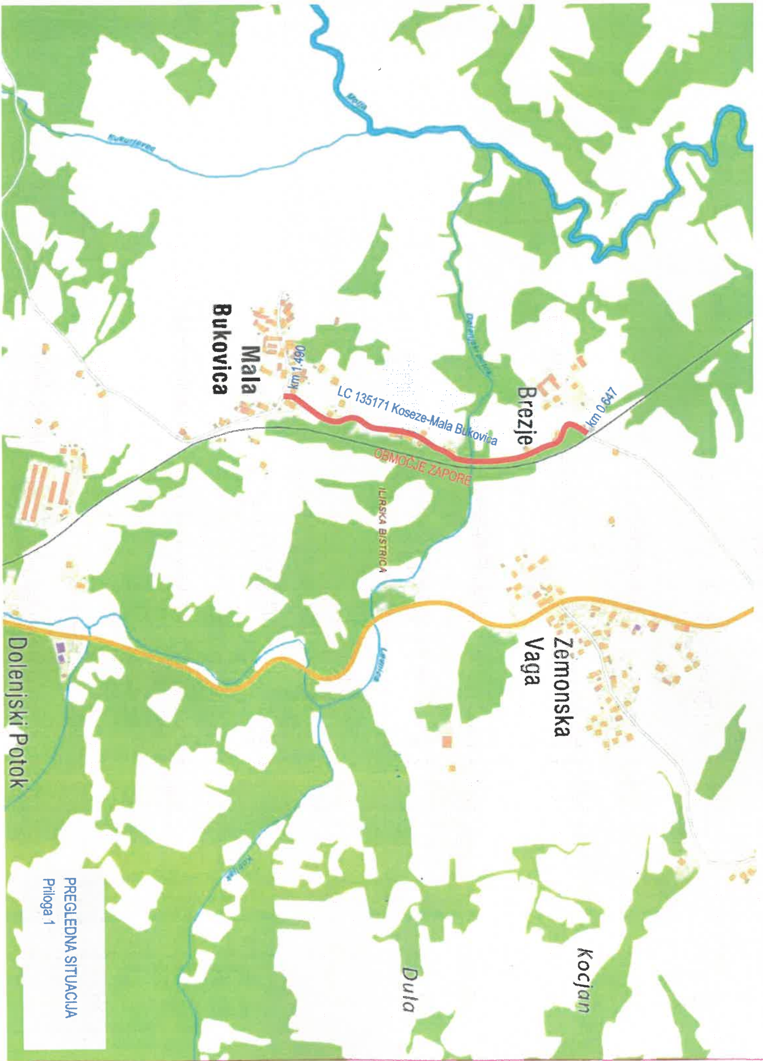
PREGLEDNA SITUACIJA Priloga 1